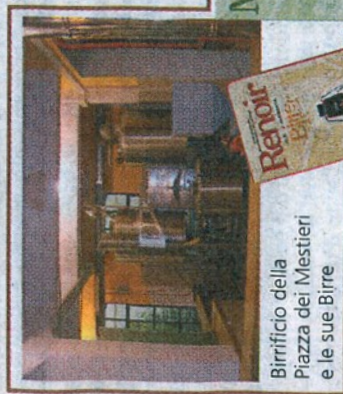
Birrificio della Piazza dei Mestieri e le sue Birre