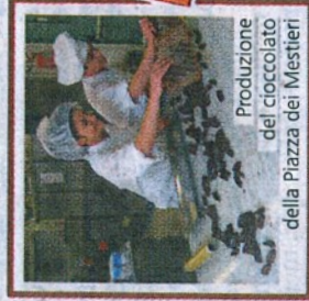
Produzione del cioccolato della Piazza dei Mestieri