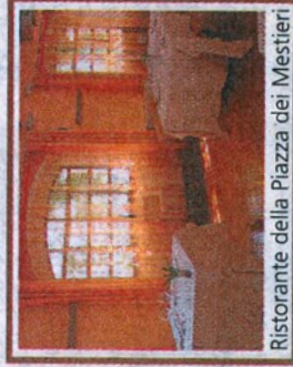
Ristorante della Piazza dei Mestieri