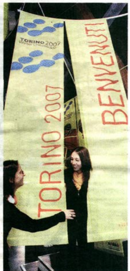
Gli stendardi delle Universiadi riecheggiano quelli dei Giochi 2006

Il tutto potrà essere seguito nei due maxischermi di piazza Vittorio, che trasmetteranno, a partire dalle 20, la diretta di Eurosport 2. Sono attesi, tra gli altri, il ministro dell'Università e della Ricerca Fabio Mussi e il sottosegretario allo Sport Giovanni Loll.