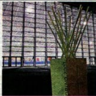
Il regno di Enrico Fabris L'Oval ospita le gare di pattinaggio di velocità, dove gareggiano gli olimpionici Fabris e Anesi. Esauriti i biglietti per l'inseguimento a squadre.