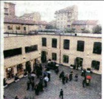
Dopo la fatica il piacere del cibo Piazza dei Mestieri (via Durandi) diventa ogni sera location del gusto con aperitivi e merende sino a prezzi contenuti.

UNIVERSIADI STASERA LA CERIMONIA D'INAUGURAZIONE