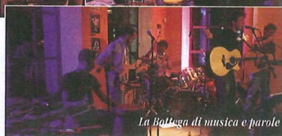
La Bottega di musica e parole