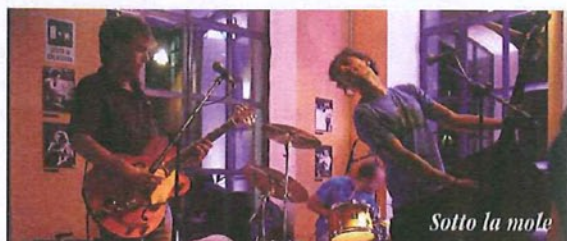
Sotto la mole