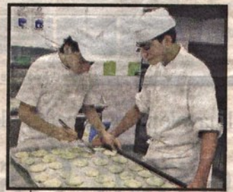
SCIVOLONE IN EUROPA Il Piemonte scivola al 138° posto su 254 regioni europee nella classifica stilata da Eurostat