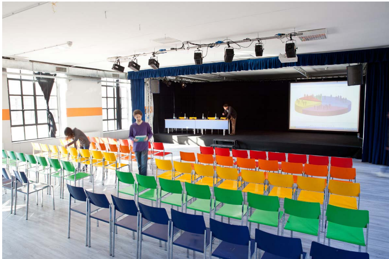
Piazza dei Mestieri > Eventi